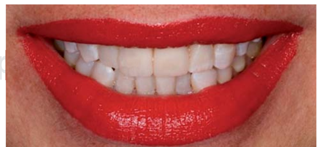
Figuras 7 y 8. Textura final de la restauración.