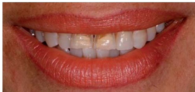
Figura 1. Situación inicial.

Se realizó un análisis de sonrisa para determinar el display de sus dientes, poder hacer un correcto diseño de sonrisa y determinar si era necesario modificar la forma y tamaño de sus dientes (Figura 3).