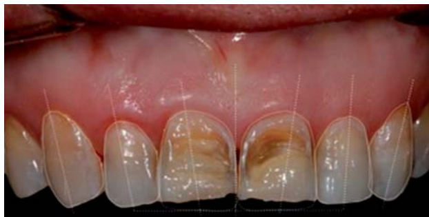
Figura 3. Diseño de sonrisa.

Se colocó un dique de goma OptraDam Plus de la marca Ivoclar, aislando solamente los dientes anteriores 11, 12, 21 y 22. Después de alisar todos los ángulos agudos de los dientes 11 y 12, los dientes fueron preparados con ácido fosfórico al 37% para recibir la resina y, posteriormente, el ExciTE F en toda su superficie, fotopolimerizándola por 15 segundos.