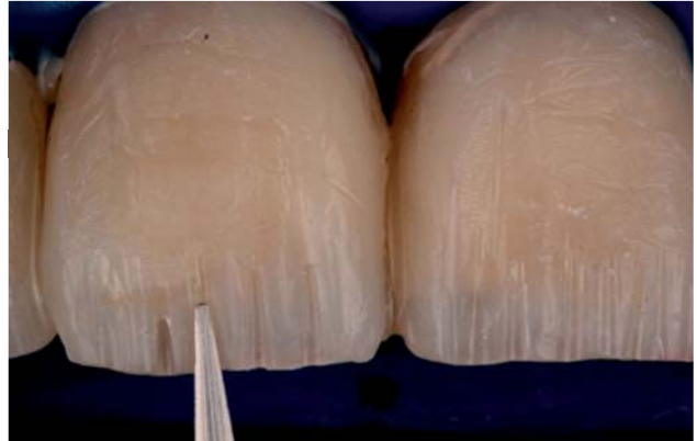
Figura 6. Cut-back .

Es importante destacar que para la realización de estas restauraciones, el operador deberá tener conocimientos sobre las técnicas adhesivas que se realizan sobre la base de la formación de una capa híbrida. Esto proporciona longevidad en las restauraciones de resina compuesta,