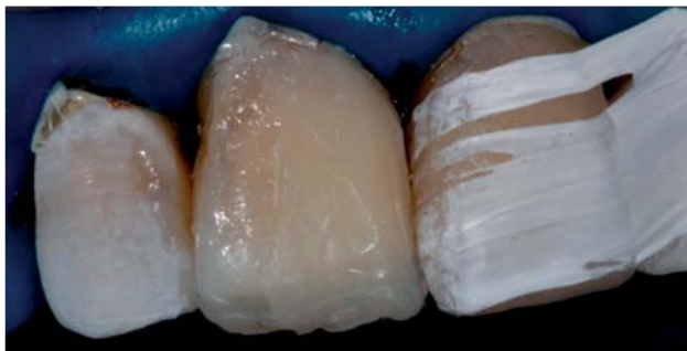
Figura 5. Estratificación de resina.