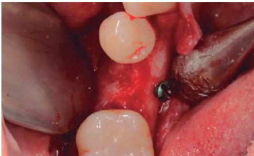
Figura 3. Segunda fase quirúrgica, aún con los tornillos de osteosíntesis.