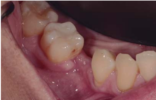
Figura 1. Situación inicial en la zona del órgano dentario 45.