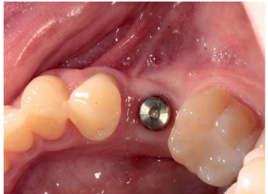
Figura 5. Vista oclusal dos meses después.