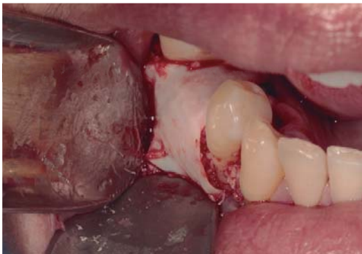
Figura 2. Regeneración ósea guiada.