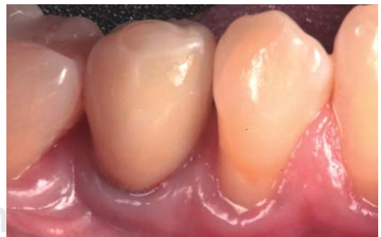
Figura 6. Restauración final con sellado de chimenea provisional. Obsérvese la compatibilidad con tejidos blandos y la conformación papilar.