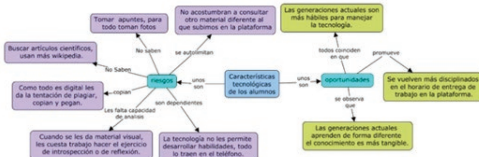
Figura 7: Citas en la categoría tecnológica de riesgo y oportunidades en los alumnos.

Las características tecnológicas que el docente señala pueden identificar en los alumnos se dividieron en una categoría emergente de “riesgo” y otra de “oportunidades”.