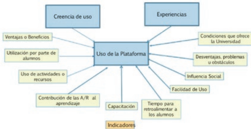
Figura 1: Categorías teóricas identificadas originalmente

Para el objeto de estudio de la investigación se planteó el siguiente esquema que son las categorías planteada para la interpretación de sus creencias y sus experiencias en el uso o no uso de las plataformas por parte de los docentes.